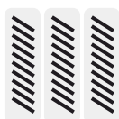
Džepčasta opružna jezgra

madrac s džepčastom opružnom jezgrom i oblogama od PU pjene